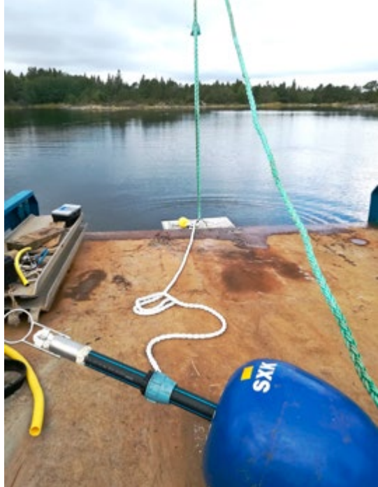
Här sänks bojsten till bojen vid Gåssten.