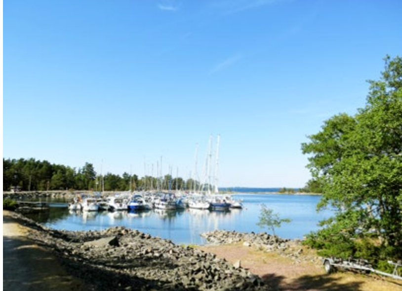
En ny favorit, Katanpää.

mycket kraftig) nordlig vind från strax efter midsommar till första veckan i juli. Vår eskader var planerad för samling vid Långskär (söder Söderarms fyr) den 8 juli. Den nordliga vinden gjorde att vi fick ändra till Arholma, östra hamnen. Dagen för samling blåste det fortfarande hård nordlig vind, 10–12 m/s, men östra hamnen är väl skyddad och vinden mojnade framåt kvällen.