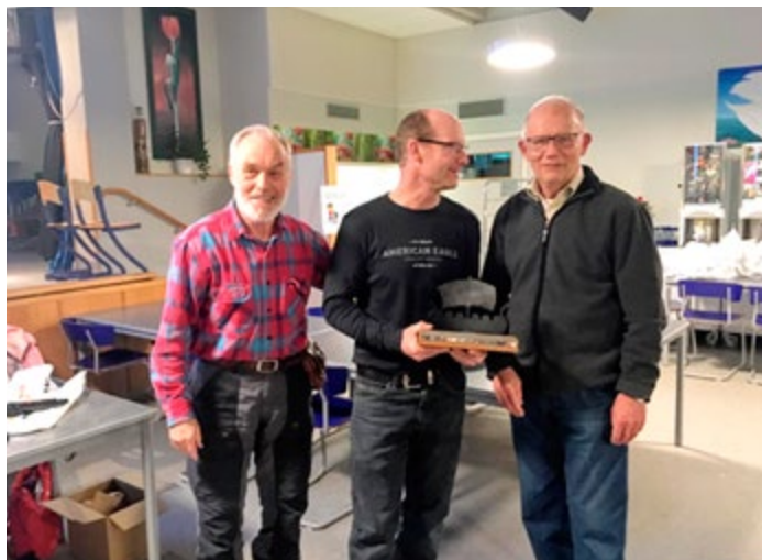
Tore överlämnade vandringspriset på ESK:s årsmöte 27 februari 2019.

men även då vill jag ha bra trim på båten. Det är roligast då! Och planera bör man ju göra även då. Middag vid midnatt, missad broöppning och överraskad av en åskfront är inte så kul. Bättre planera, precis som på 6-timmars.