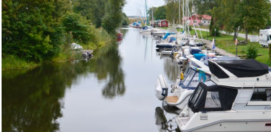
Hamnen i Örsundsbro med båtklubben i bakgrunden.