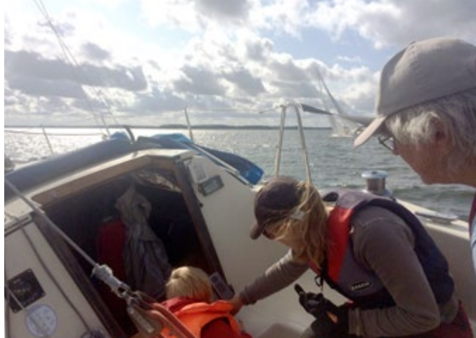
Lagom vind vid Singösexan hösten 2018.