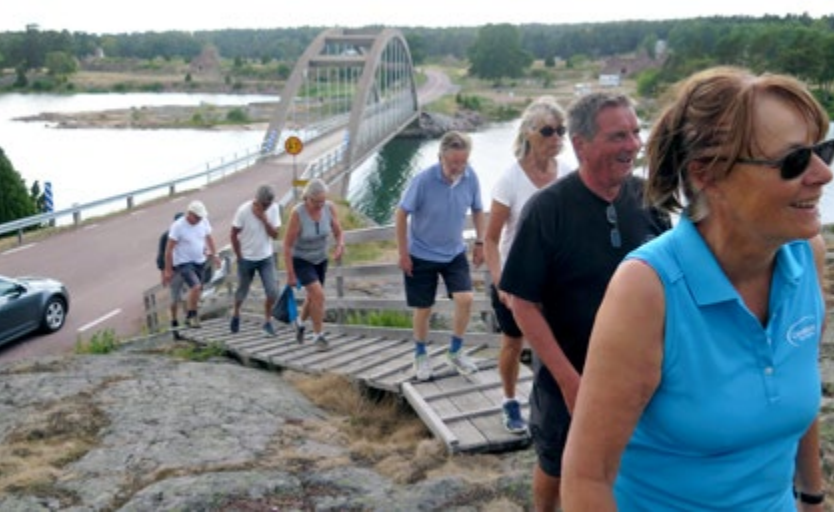
På väg mot museet i Bomarsund. Vål värt ett besök!