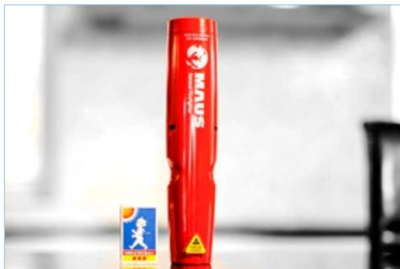
MAUS, en helt ny typ av brandsläckare.