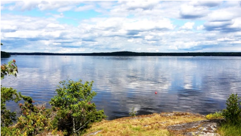
Från Säbyklint, Ekoln.

Avsändare: Svenska Kryssarklubben Uppsala-Roslagskretsen c/o Bo Nordlund Orphei Drängars Plats 5 75311 UPPSALA