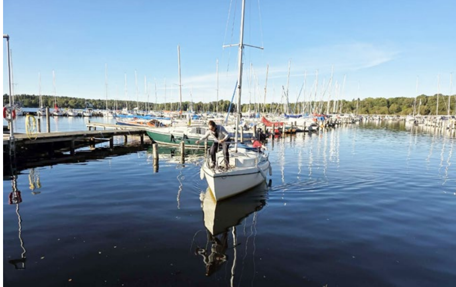
Masten är på!