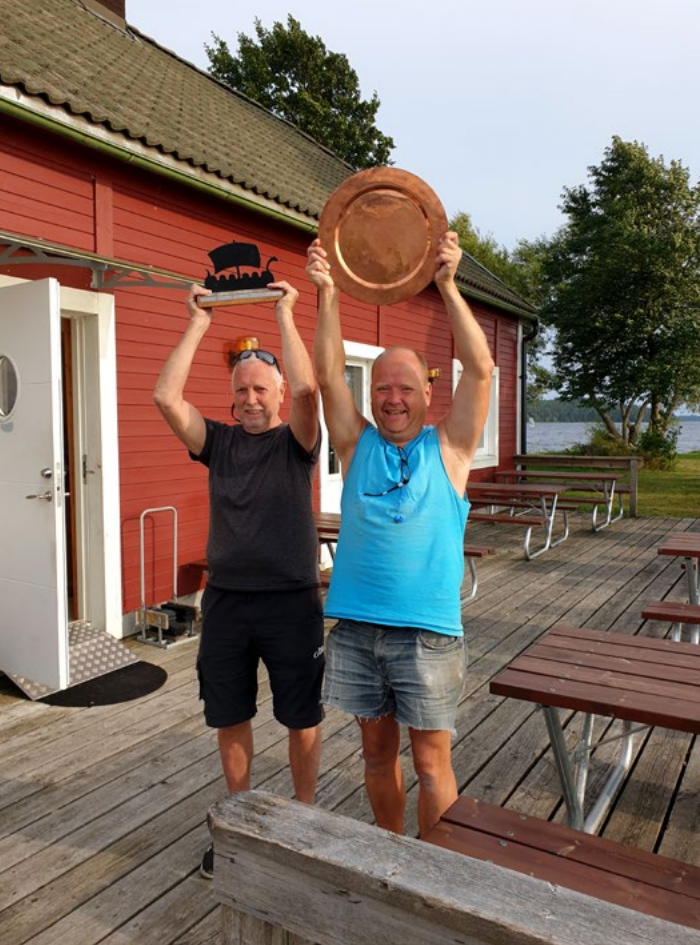
Två glada vandrings- pristagare 2024.