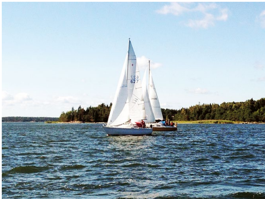
Från Singösexan 2015.