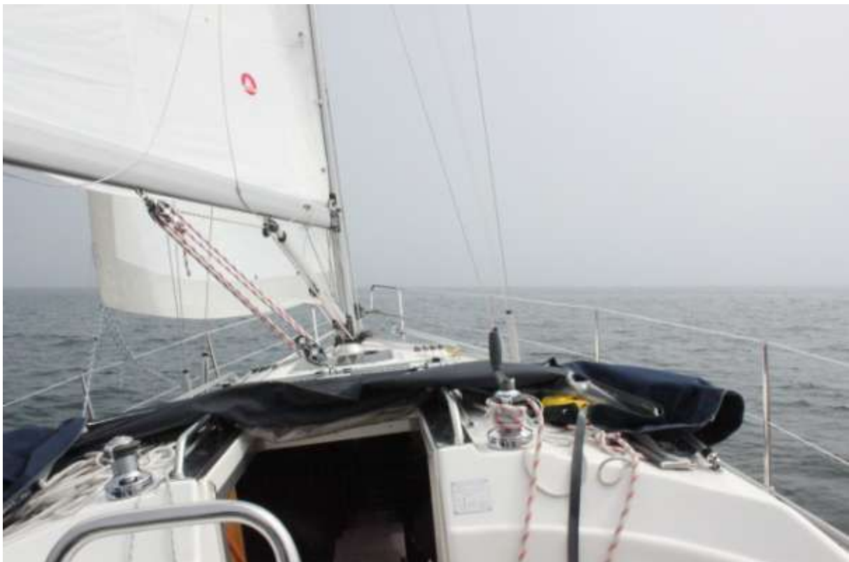
Mot fjärran kust.