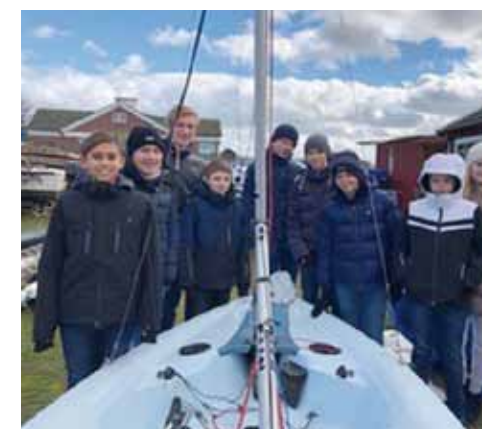
Seglarskolan är igång redan i mitten på mars

- Vill man åka till Helsingborg går bussen med täta turer från en hållplats 100 m bort.