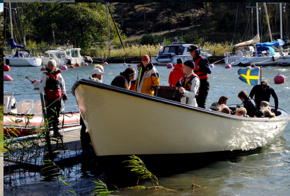
Foto Seglarlägret Malma Kvarn