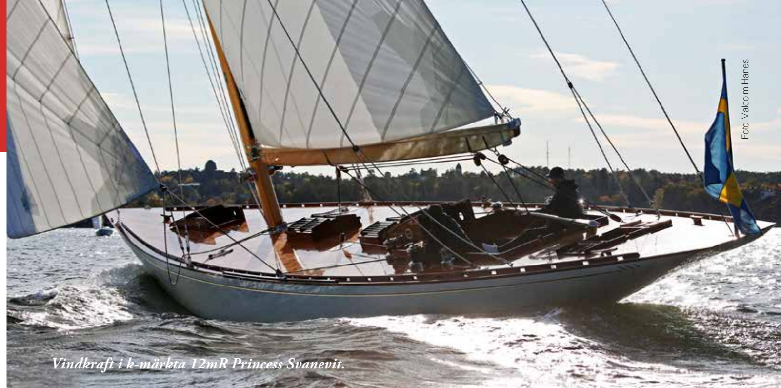
Vindkraft i k-märkta 12mR Princess Svanevit.

Logga in på SXK:s webbutik med 20 % på alla varor! Sjösäkerhet, textilier, böcker och medlemsvaror. sxk.se/webbutik