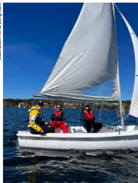
Foto Seglarlägret Malma Kvarn