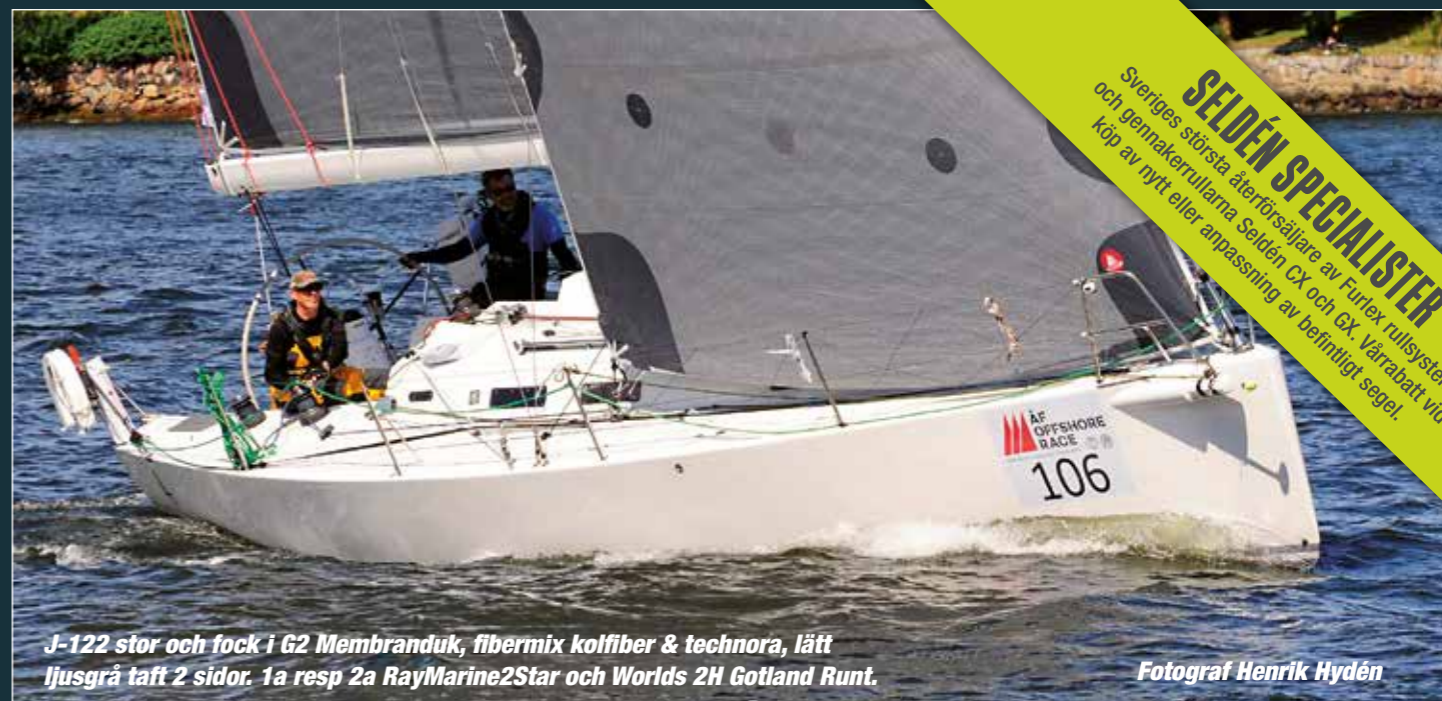
J-122 stor och fok i G2 Membranduk, fibermix kolfiber & technora, lätt ljusgrå taft 2 sidor. 1a resp 2a RayMarine2Star och Worlds 2H Gotland Runt.

Mälarvarvsbacken 14 117 33 Stockholm Tel: 08-669 01 05 www.propellertrim.se