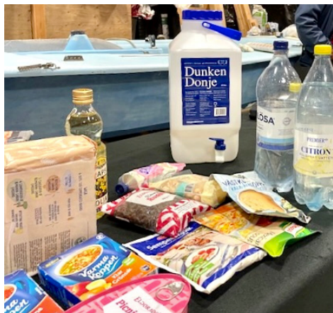
Sune plockade ihop en utställning i båthallen med olika prylar som man kan behöva i kristider.