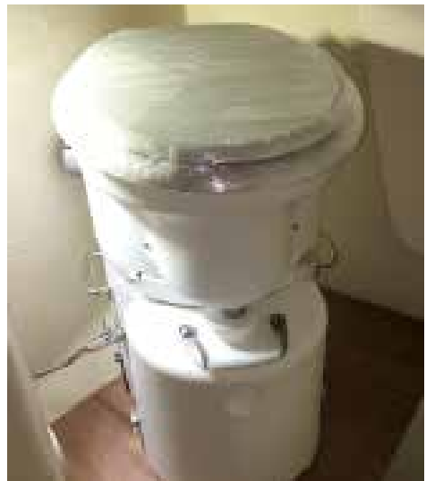
Exempel på installering av en mulltoa. Ofta behöver man bara ansluta en mindre ventilerande skorsten och el till fläkten.

Det behövs säkert flera förslutningsbara urinbehållare ombord för att slippa