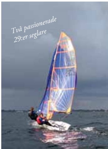
Två passionerade 29:er seglare

Det skall var trevligt att segla tillsammans. Naturligtvis kan det börja regna och blåsa till oväntat. Men vi har alltid försökt lyssna noga på väderrapporter och hellre avstå från att segla dagar med dåliga utsikter. Det finns nästan alltid något intressant att göra på land också. Bättre att förflytta sig och båten till en hamn, där man kan göra utflykter eller bara känna sig trygg i dåligt väder.