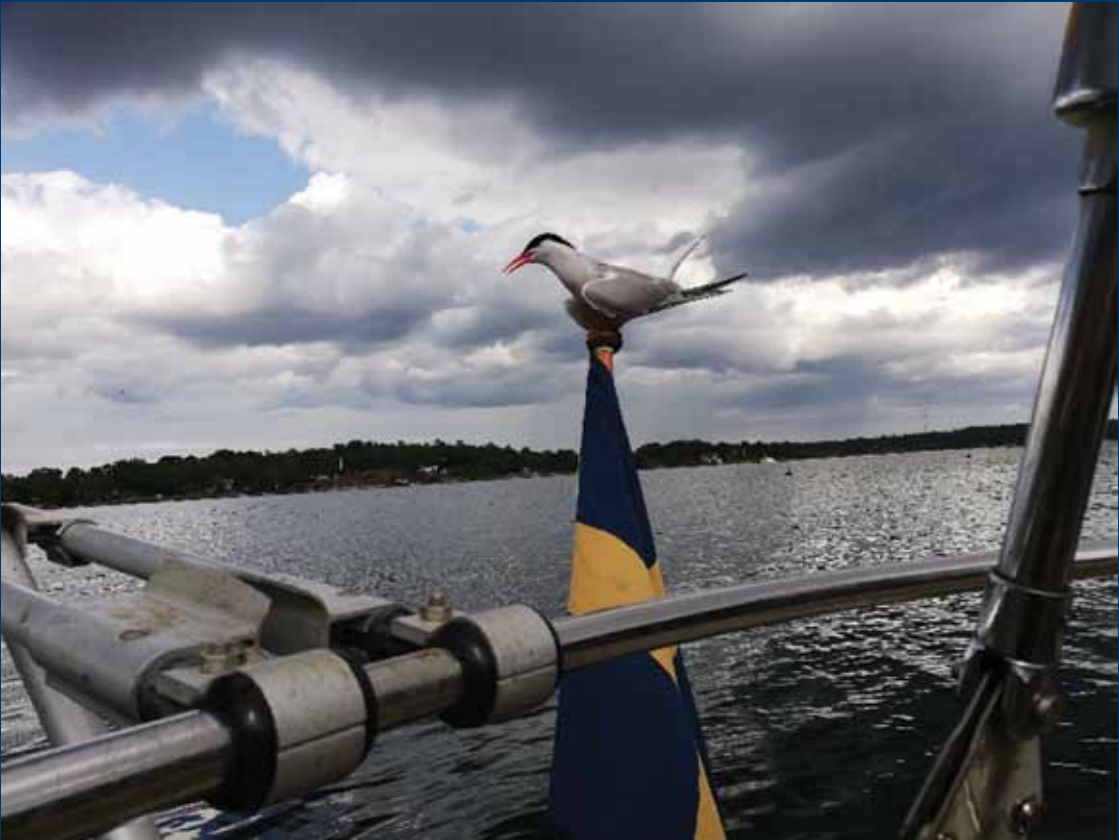
Tärna på Tärnö...