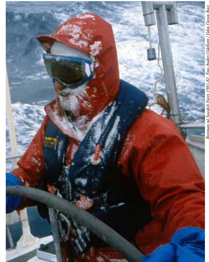
Rasmus på Svenska Entry 1981-82.

En sak är i alla fall klar: Båtarna kommer att segla i svenskt vatten igen!