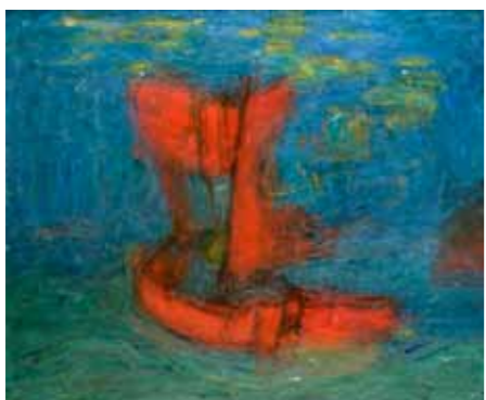
Carl Kylberg Den flygande holländaren. 1932. olja på duk.