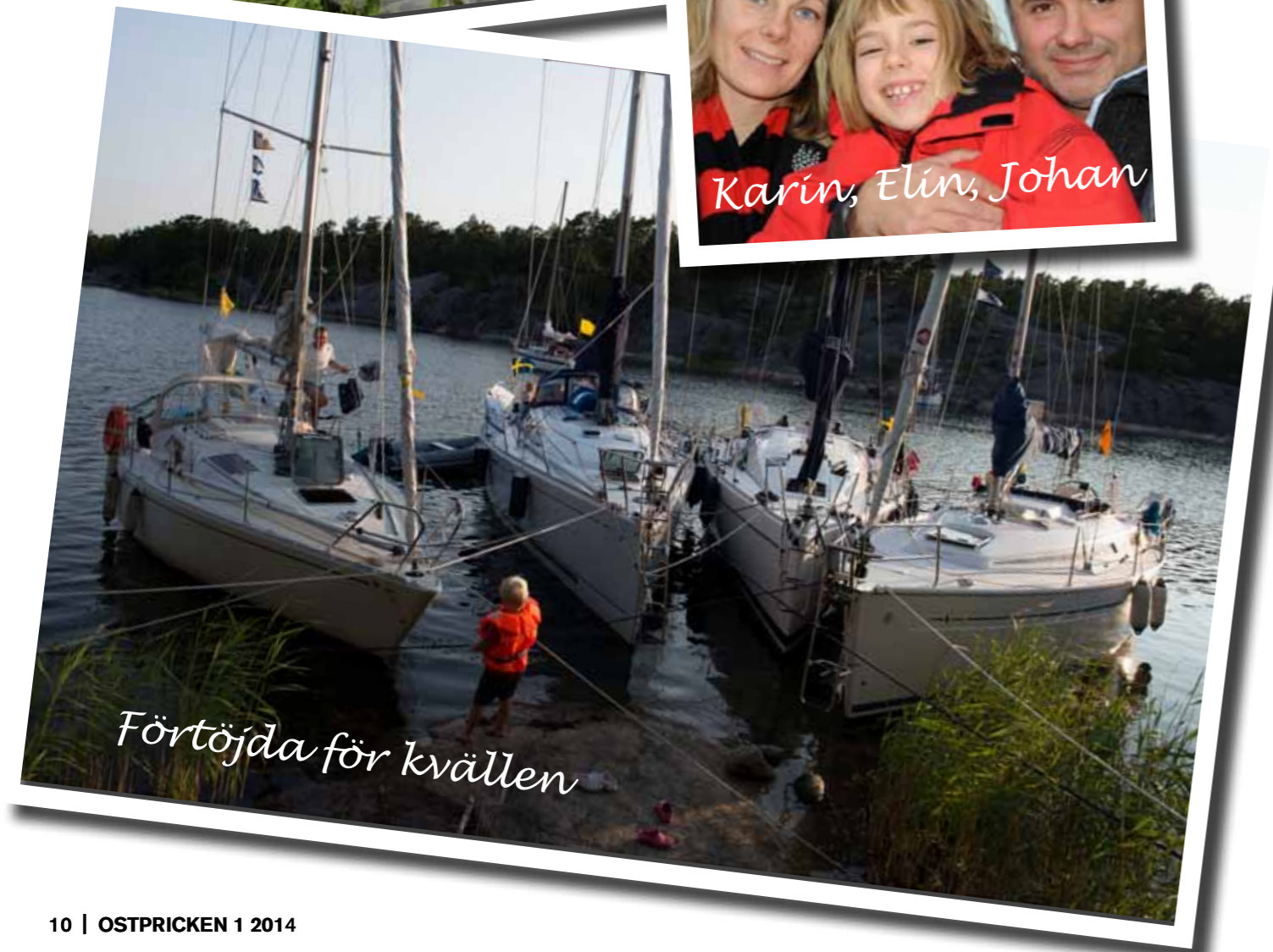
Förtöjda för kvällen