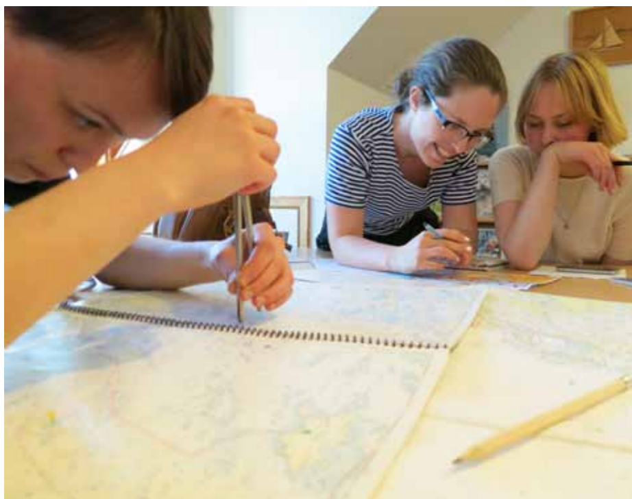
Koncentration och upplägg av en 24-timmarssegling på torra land. Den 24 april, (vilket datum annars), har du en ny chans att vara med!