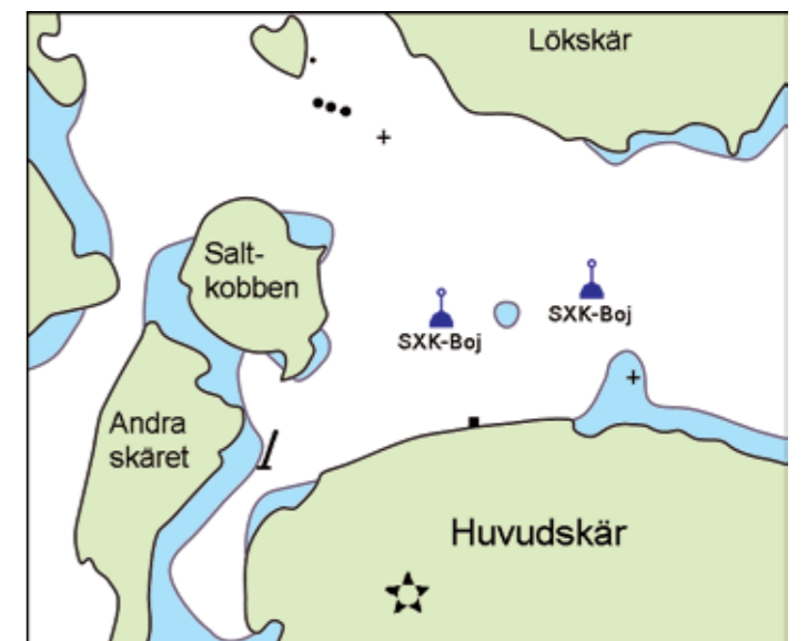
Huvudskär Sjökort 616 N 58°57',910 E 18°34',130 Bsp Stockholm Södra sid. 36,43. Bojarna ligger i fladen Ålandsskär-Lökskär.