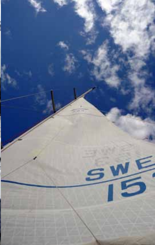
Två rev i storen.