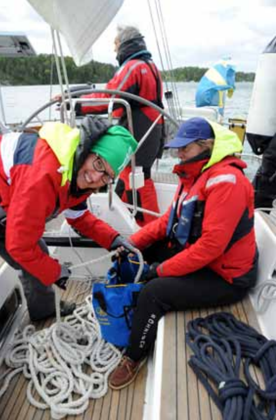
Kvejla, eller rakt ner i påsen är frågan.