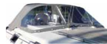
Foto: Hanse 470 på Gålö. 22mm rostfria bågar med stora fönster. WeatherMax #91 grå belagd kapellväv

Moderna stora fönsterpartier. Rostfria bågar ger suverän stabilitet. Ny känsla i sittbrunn. Vi besöker din båtklubb/marina, mallar & slutmonterar. Hösterbidande sprayhood gäller vid mallning och produktion i period oktober-december.