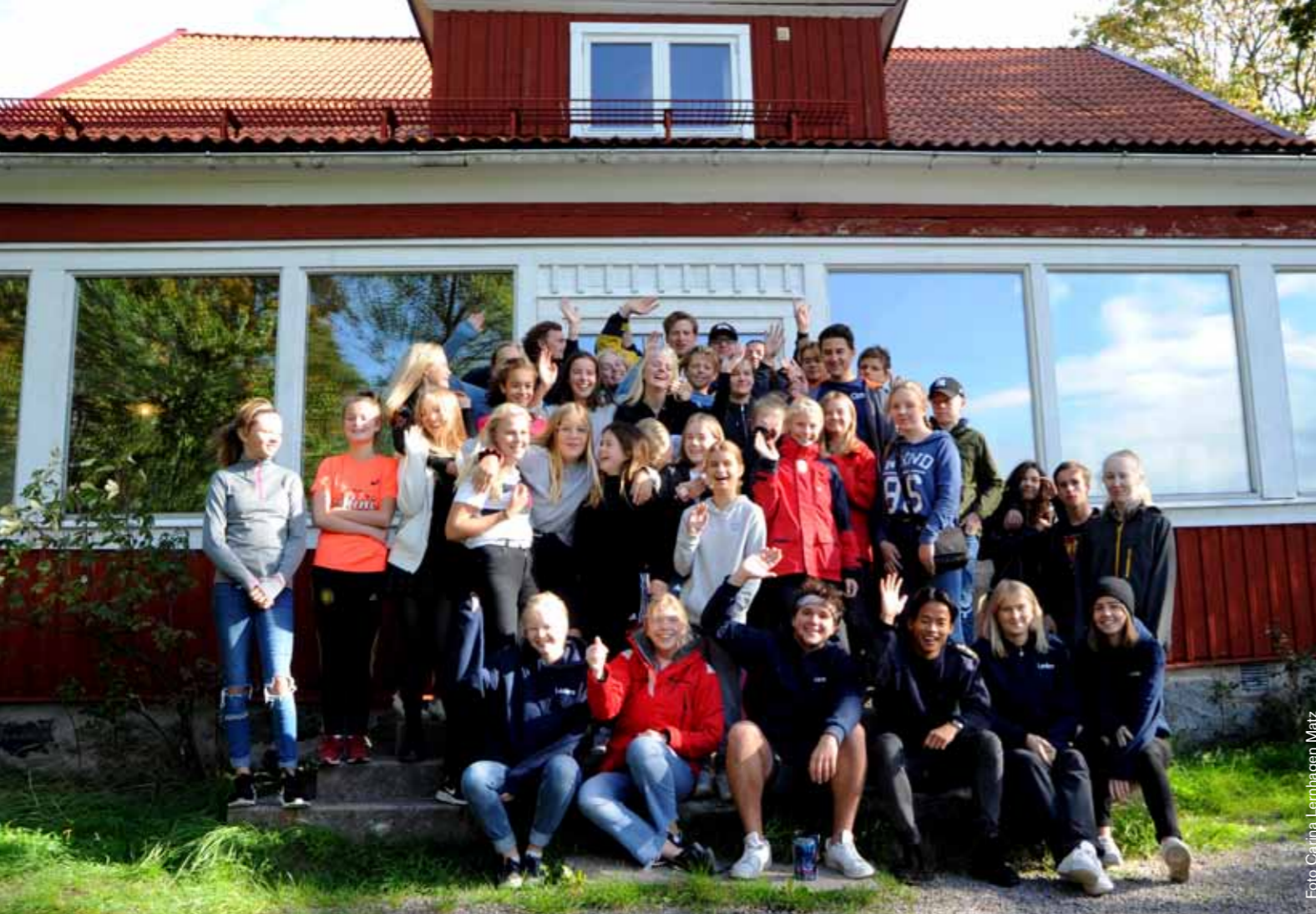
Under två helger i september var det återträffar på Malma Kvarn för barn och ungdomar som varit med på seglarläger under sommaren 2018. Här är det ungdomar och ledare som ser fram emot en glad återträff helgen den 22-23 september.