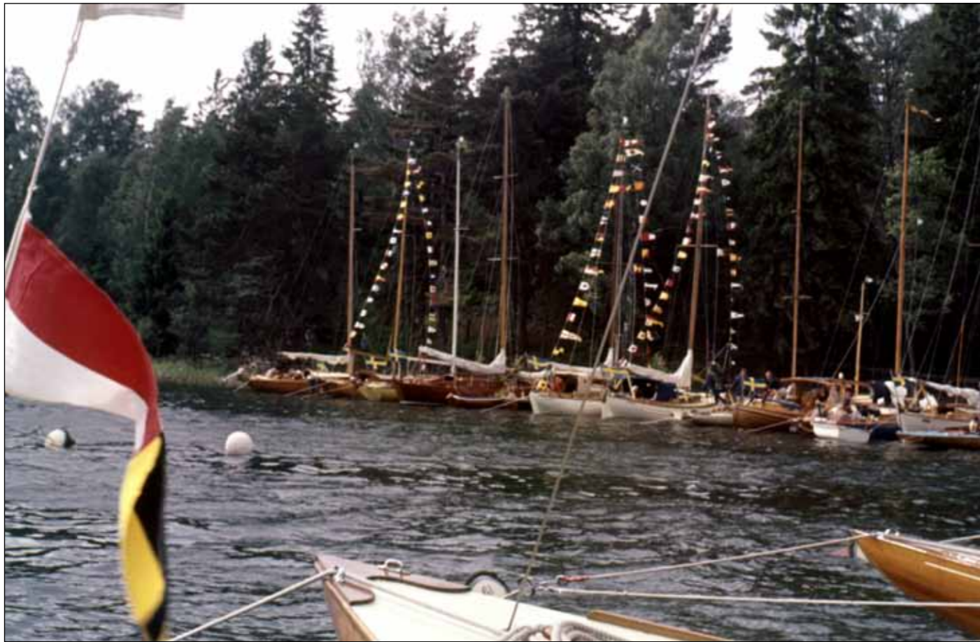
"Midsommar på Kryssarklubbens Malma Kvarn 1962. Det blåste hårt från syd." Text på diaramen, fotografen hette Aina Palmér. Gästande båtar, de allra flesta i trä, ligger på ankare i aktern mot stranden som idag är jolleramp för Seglarlägrets Tvåkronor. Alla som har ett signalställ har satt det i den friska vinden. Bilden är ett fynd i Sjöhistoriska museets fotoarkiv.