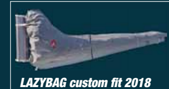
LAZYBAG custom fit 2018

10-20% RABATT BESTÄLL SENAST 15 NOVEMBER