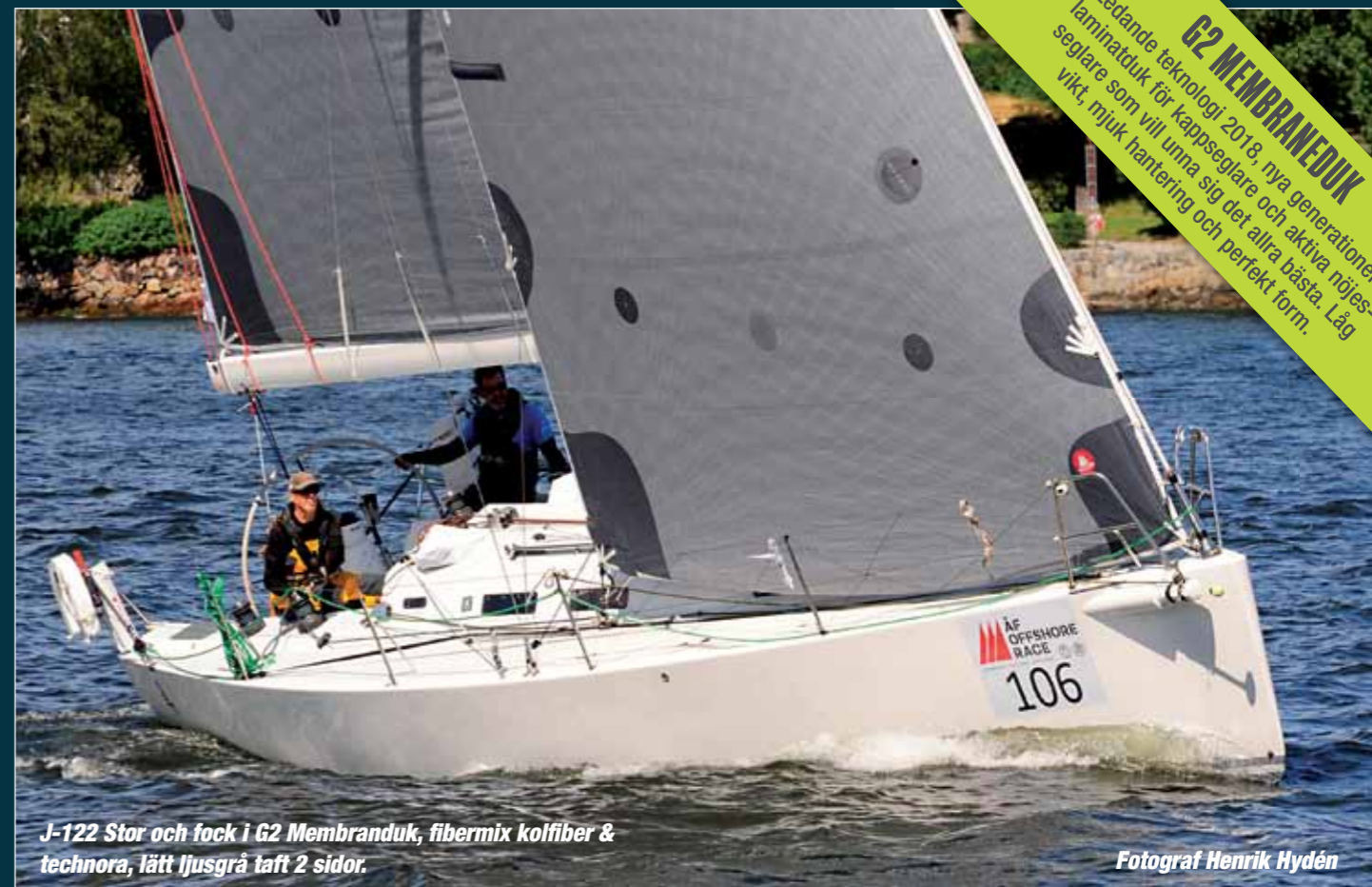
J-122 Stor och fok i G2 Membranduk, fibermix kolfiber & technora, lätt ljusgrå taft 2 sidor.

För alla programpunkter gäller info, anmälan och betalning på www.sxk.se/stockholmskretsen