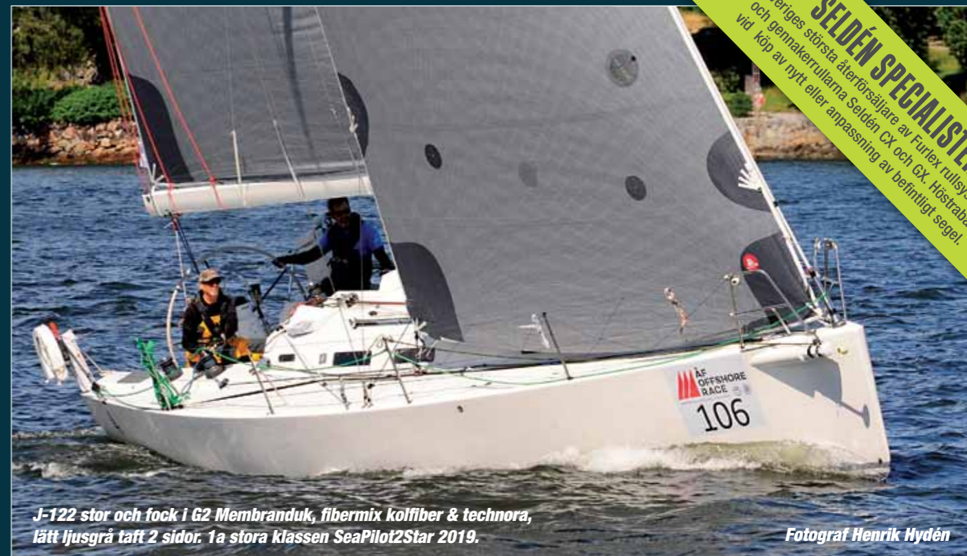
J-122 stor och fock i G2 Membranduk, fibermix kolfiber & technora, lätt ljusgrå taft 2 sidor. 1a stora klassen SeaPilot2Star 2019.

KURS Utsjöskepparkurs Söndag 17 och söndag 24 november, kl 9-16 bägge dagarna. Nacka Strand.