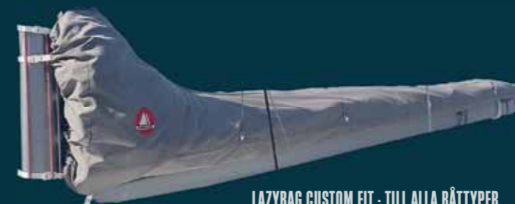
LAZYBAG CUSTOM FIT - TILL ALLA BÅTTYPEN

Besök oss på segelmakeriet, eller skriv till info@boding.se så svarar vi med aktuella värbjudanden till just din båt. Gäller vid beställning senast 25 maj.