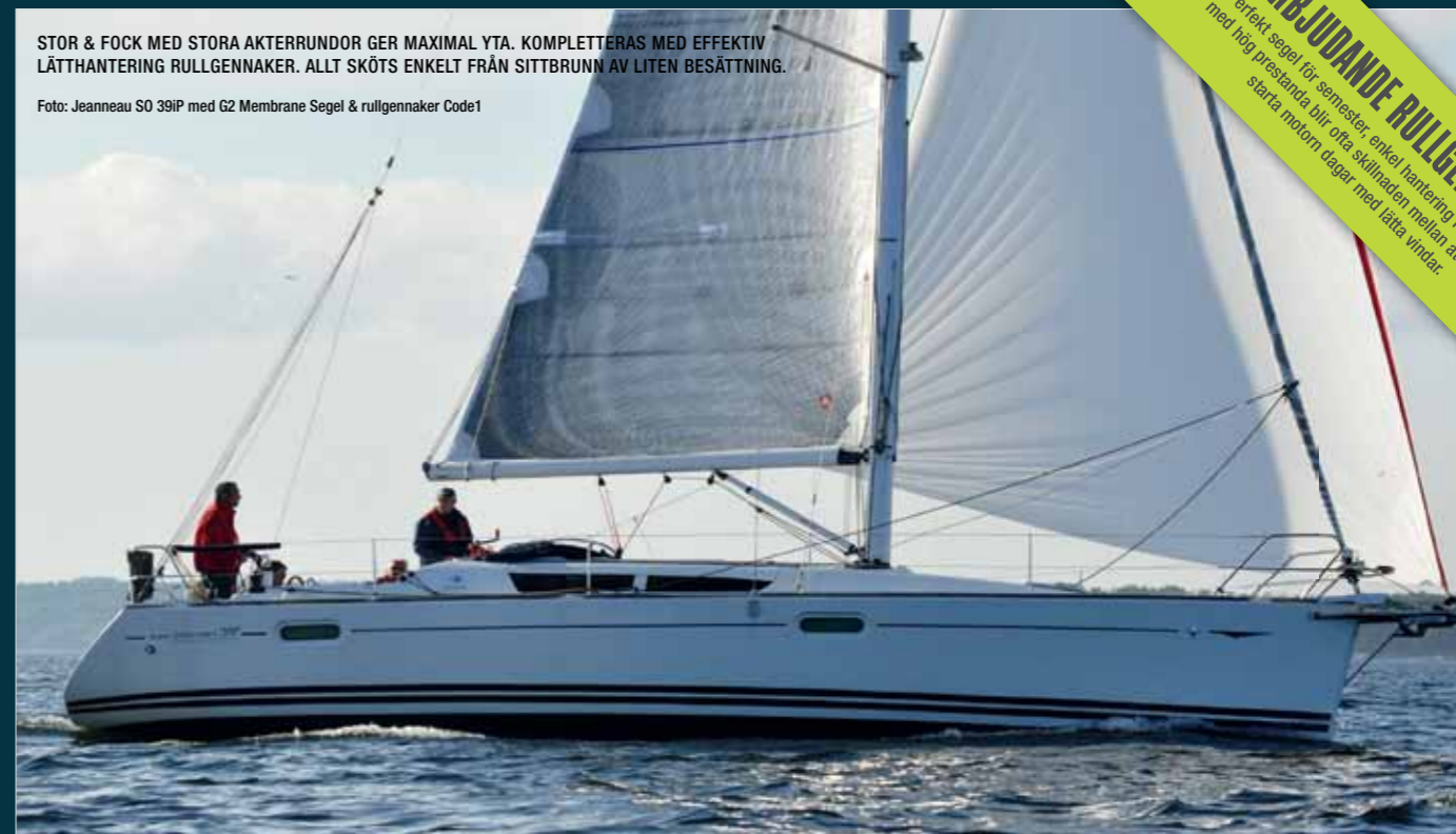
STOR & FOCK MED STORA AKTERRUNDOR GER MAXIMAL YTA. KOMPLETTERAS MED EFFEKTIV LÄTTHANTERING RULLGENNAKER. ALLT SKÖTS ENKELT FRÅN SITTBRUNN AV LITEN BESÄTTNING.

Torsdagen den 20 september kl 11 ordnar vi en "Bryggerivisning med bryggarbricka och ölprovning" på Nynäshamns Ångbryggeri. Kostnad 395 kronor. Förhandsanmälan obligatorisk via hemsidan före 1 sept. Arr Seniorkommittén