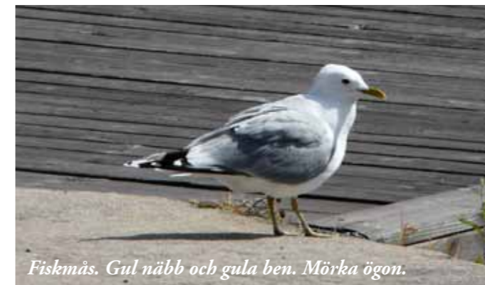
Fiskmåsen. Gul näbb och gula ben. Mörka ögon.