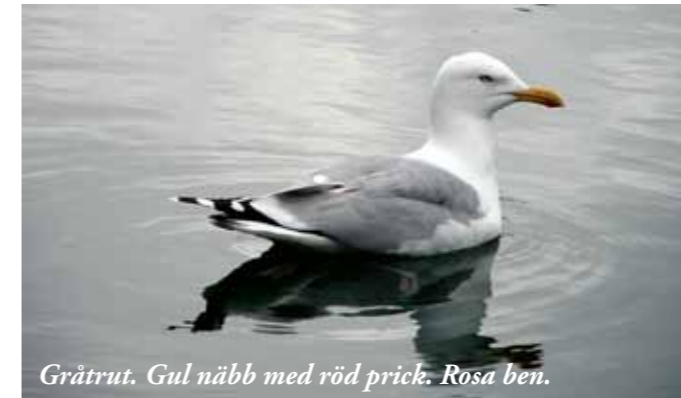
Gråtrut. Gul näbb med röd prick. Rosa ben.

Att skilja på fisktärna och silvertärna kan dock vålla en del bekymmer. Silvertärnans vingar är i motljus genomlysta till halva bredden och den har helt röd näbb. Fisktärnans vingar