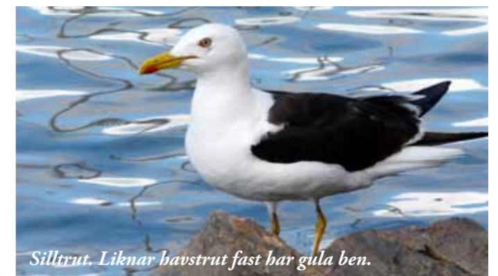
Silltrut. Liknar havstrut fast har gula ben.