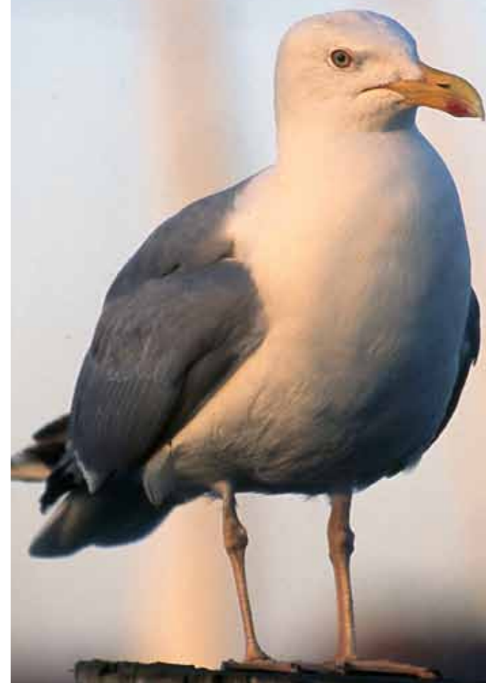
Fiskmåsen eller gråtrut?