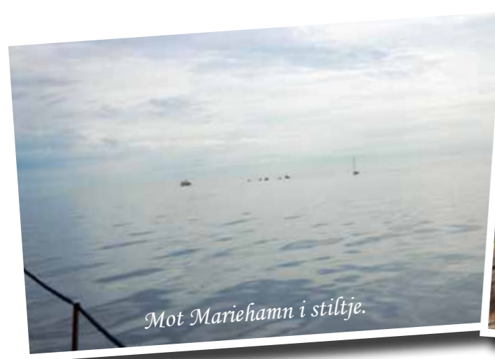
Mot Mariehamn i stiltje.