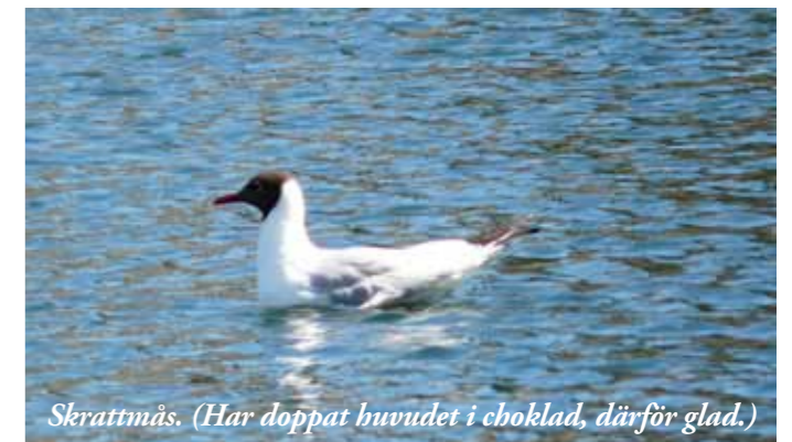
Skrattmåsen. (Har doppat huvudet i choklad, därför glad.)