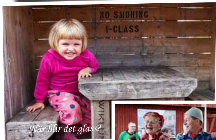
När blir det glass?