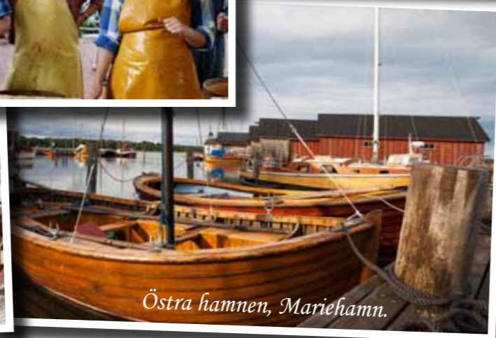
Östra hamnen, Mariehamn.