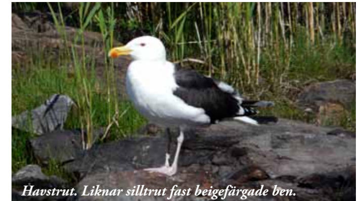
Havstrut. Liknar silltrut fast beigefärgade ben.