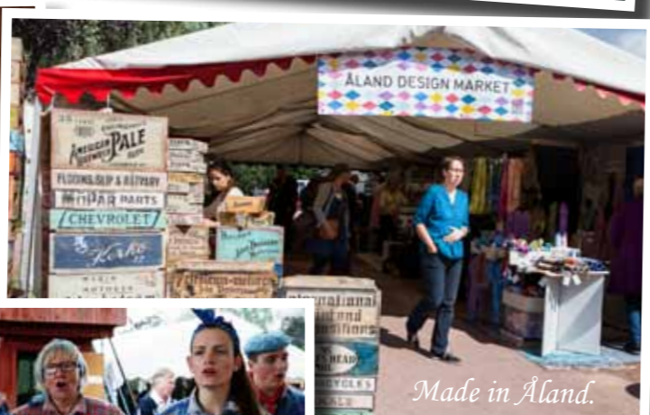
Made in Åland.