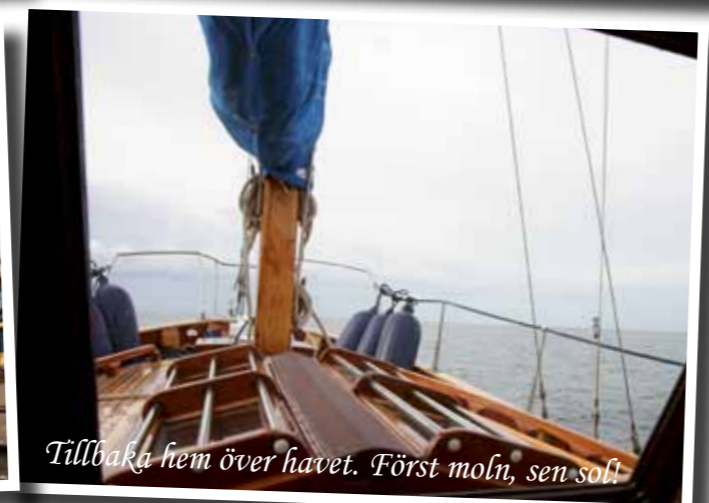
Tillbaka hem över havet. Först moln, sen sol!