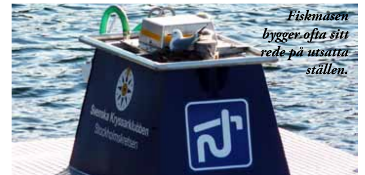
Fiskmåsen bygger ofta sitt rede på utsatta ställen.

är endast genomlysta längs bakre kanten och den har röd näbb med svart spets. Fisktärnans stjärtspröt sticker inte ut bakom de hopslagna vingarna, medan silvertärnans sticker ut något. En sittande silvertärna har kortare ben än fisktärnan, utan synliga ”knän”. Hängde ni med?