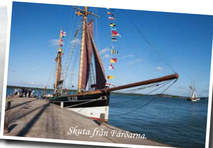
Skuta från Färöarna.