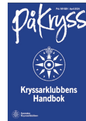
Ovan: Test årsskrift . Vänster: Skisser På Kryss och exempel på en artikel.