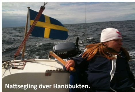
Nattsegling över Hanöbukten.

De flesta som har hyrt någon av IF-båtarna har seglat i Sörmlands skärgård. Barnfamiljerna kom inte så långt. Men här följer två långseglingsbeskrivningar.