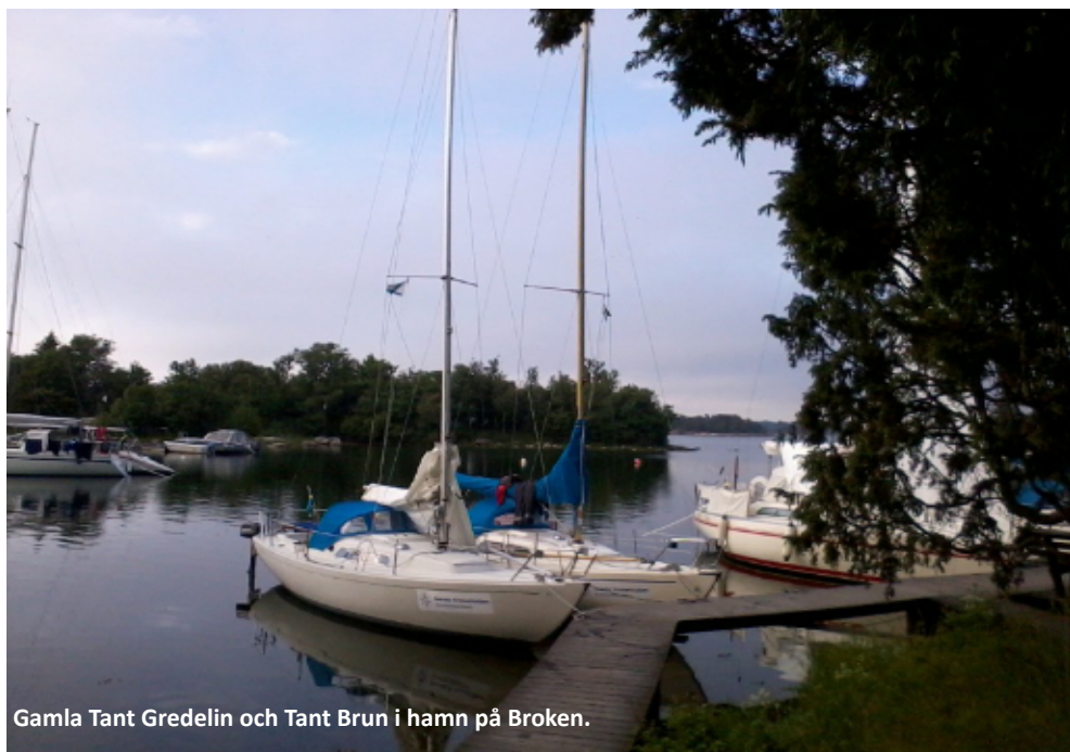
Gamla Tant Gredelin och Tant Brun i hamn på Broken.

IF-båtarna ligger sommartid i gästhamnen i Nyköping. Incheckning och utcheckning sköts av Gästhamn Nyköping. Båtarna kan checkas ut tidigast kl 18 00 och ska lämnas in senast kl 14 00. Vid utlämningen krävs skriftligt kontrakt och bevis på medlemskap och seglingskompetens. Samtidigt sker en genomgång bl a av tekniska detaljer och säkerhetsutrustning. Vid utcheckningen görs en genomgång och kontroll av förtöjning, motorn, seglen, bränsle & gasol, ev. skador & städning mm.