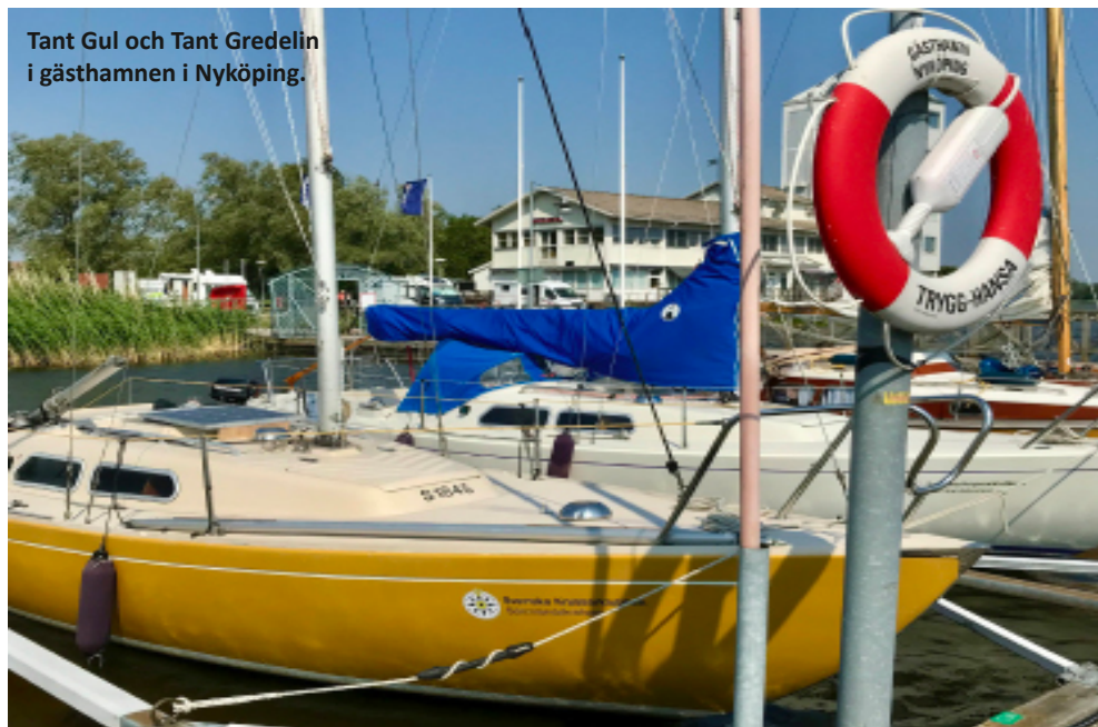
Tant Gul och Tant Gredelin i gästhamnen i Nyköping.