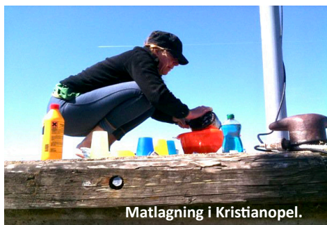
Matlagning i Kristianopel.