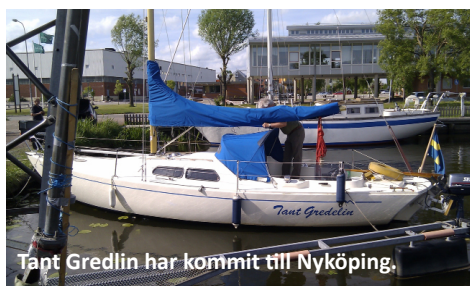
Tant Gredlin har kommit till Nyköping.

Jessica Eklöf och Annica Edwall (Text&foton)