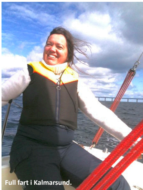
Full fart i Kalmarsund.