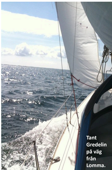
Tant Gredelin på väg från Lomma.