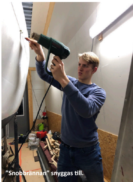
"Snobbrännan" snyggas till.