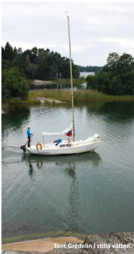
Tant Gredelin i stilla vatten.