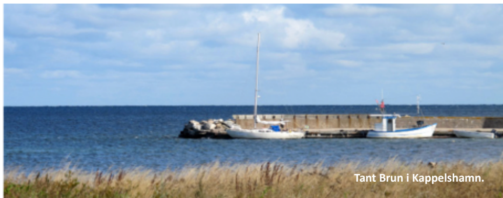
Tant Brun i Kappelshamn.