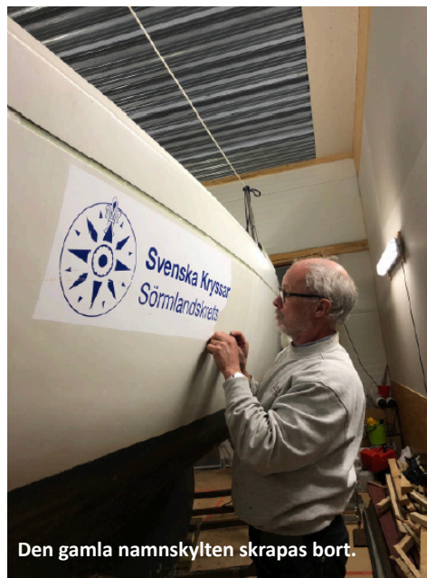
Den gamla namnskylten skrapas bort.