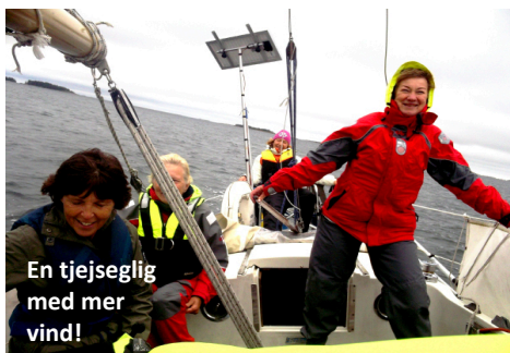
En tjejeselig med mer vind!