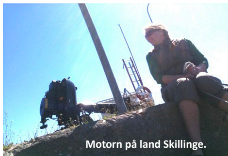
Motorn på land Skillinge.

Åskväder med hagel på eftermiddagen - brr. Motortrassel igår fick vi hjälp att lösa, båten har ett gammalt, rörligt motorfäste och det är svårt (och tungt) att lyfta upp motorn vid segling. Tråkigt nog fortsatt trassel med fästet på eftermiddagen så att vi inte kunde köra motor och fick hjälp in till Skillinge. Ny hjälp med fästet i förmiddags. Lunch i Skillinge fiskehamn.