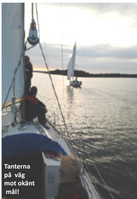
Tanterna på väg mot okänt mål!