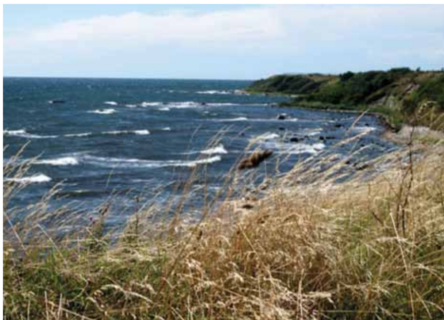
Arnager - Rønne