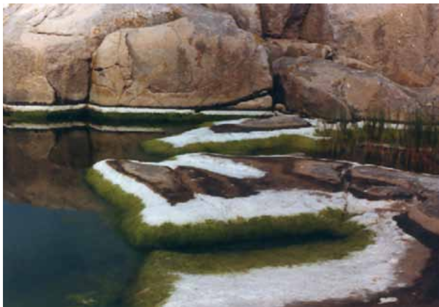
Hällkar på Utklippan

Namnet är från 1500-talet och tillskrivs uppfinnaren, den spanske fältherren och hertigen av Alba, Duc d'Albe. Anordningen anses ha använts första gången i floden Schelde under Spaniens belägring av Antwerpen 1584 – 1585. Dalbe är det holländska ordet för påle. Det finns även andra tankegångar kring ordets ursprung.