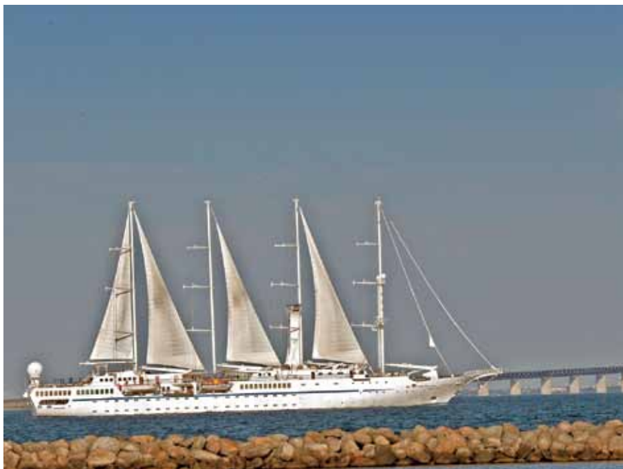
Har Du för många tampar att sköta - Wind Spirit har fler ..