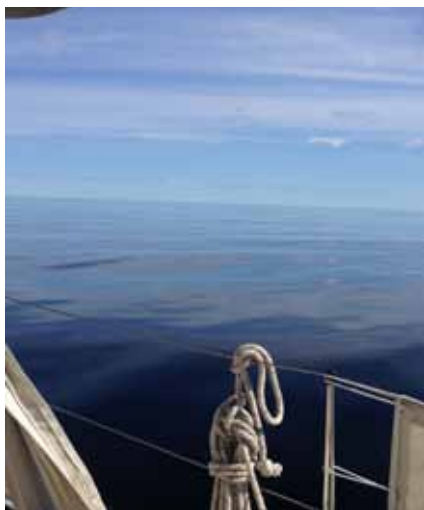
Gävlebukten eller södra Bottenhavet en förmiddag. En vision av oändligheten...

Nästa dag började bra, barometern hade stigit på ett dygn med 20 mb! Vinden var fortfarande västlig, men hade avtagit till 8-14 m/s. Vi gick mest för maskin och var till större delen ensamma i Roslagens famn. Anlände tidigt på eftermiddagen till ett solvarmt Öregrund och fick gott om tid att bunkra livsmedel och spankulera omkring i gränderna med de välbevarade husmiljöerna. Vi fick också tillfälle att gå ombord på fyskeppet Västra Banken, som är ett lätt igenkännbart monument och landmärke från en svunnen tid. Annars var krögarna i full sysselsättning med att färdigställa sina sommarkrogar längs hamnbryggorna.