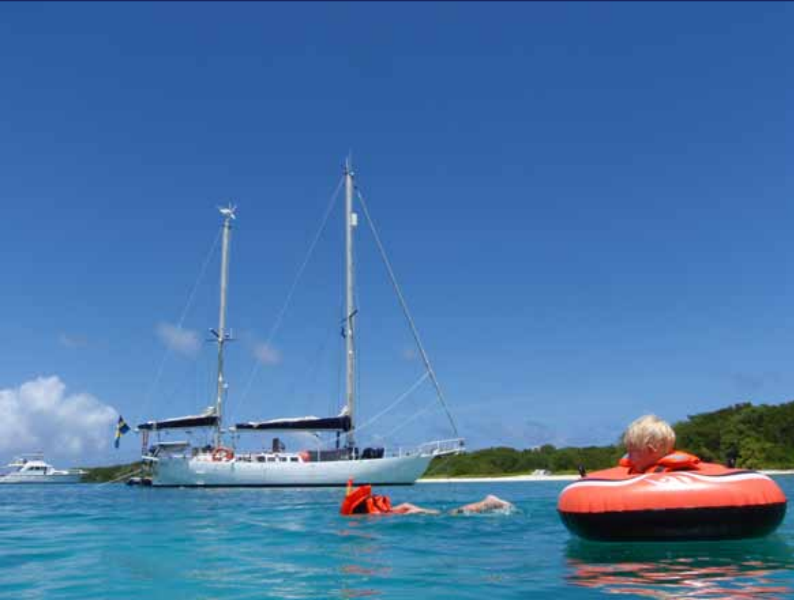
Mary af Rövarhamn - båt och bad...