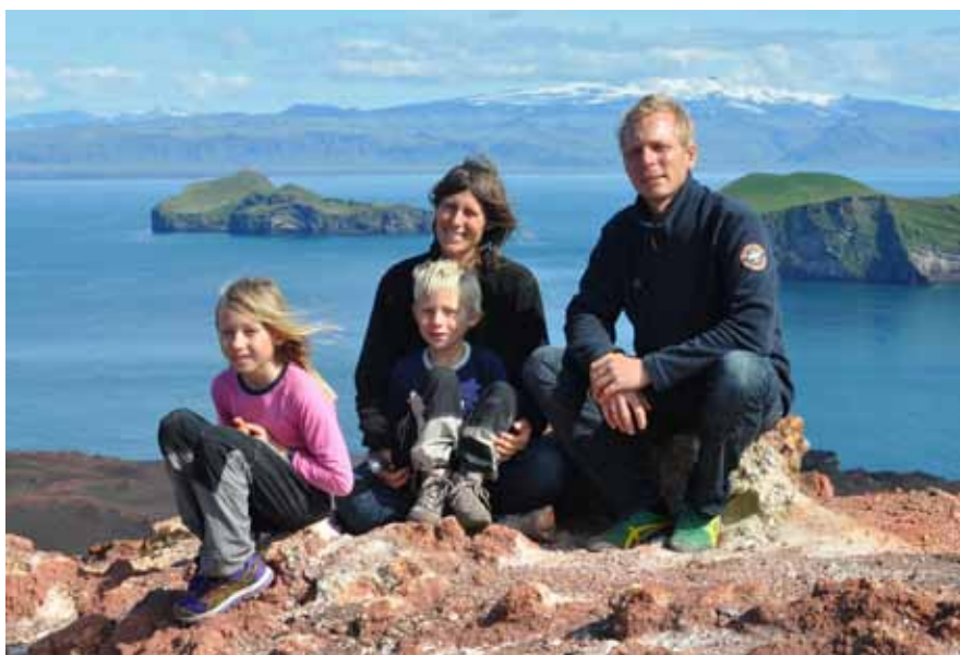
Familjen på Mary af Rövarhamn