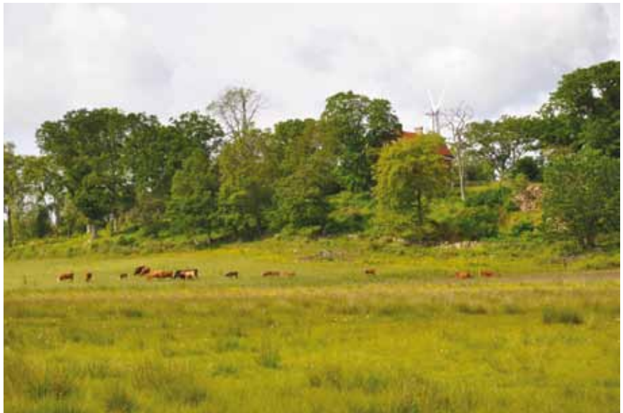
Utsikt från Väbyån