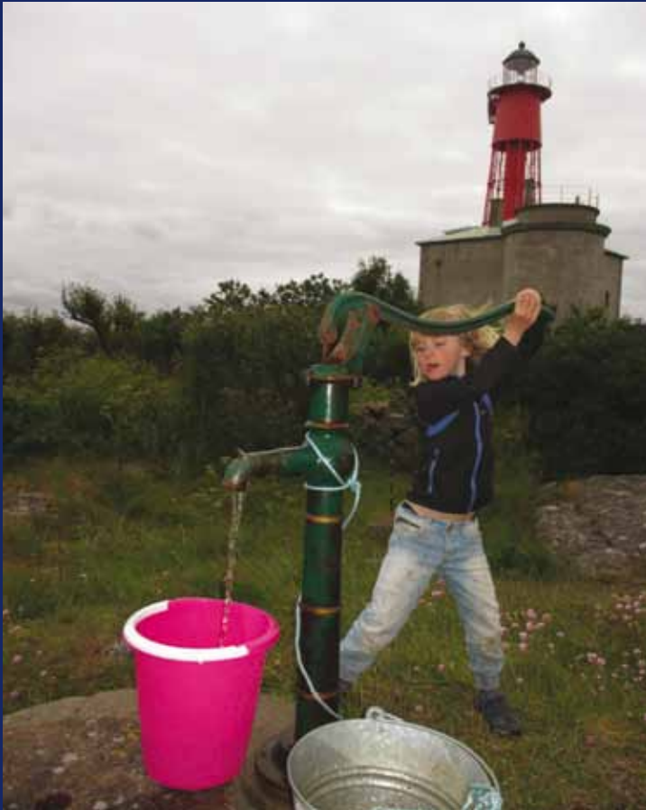
Full aktivitet på Utrklippan...