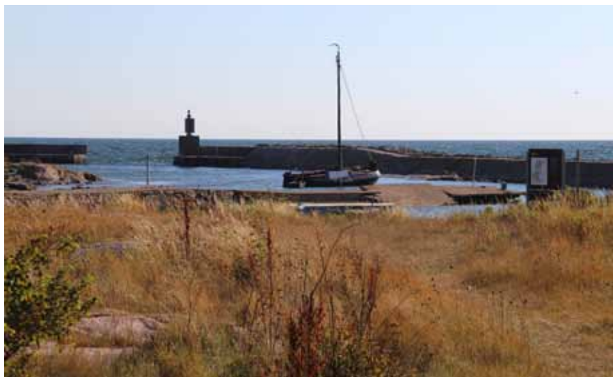
Ovanligt besök, en 12 m lång tysk båt ankrad mellan Östra piren och Mellanskär, förklaringen den hade bara 70 centimeters djupgående..