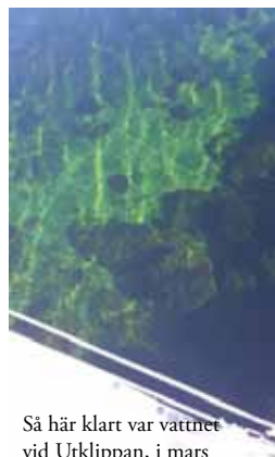
Så här klart var vattnet vid Utklippan, i mars 2017, djupet är 3 m