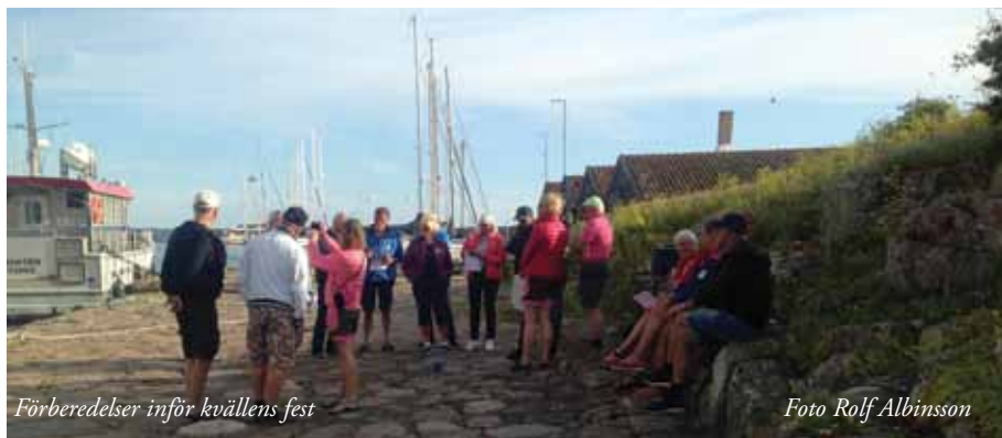
Förberedelser inför kvällens fest