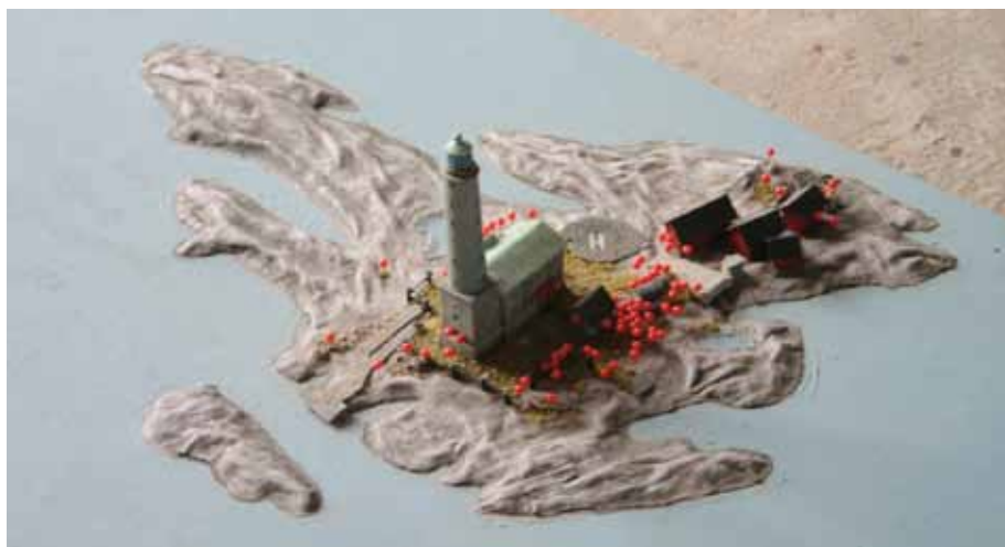
På bilden, visande en modell av skäret och fyren, framgår hur dominerande fyren är på ön. Var och en av de röda kulorna representerar en ruvande ejder.

Ornitologer varnade för att en tillströmning av turister skulle hämma fågellivet men det blev tvärt om.