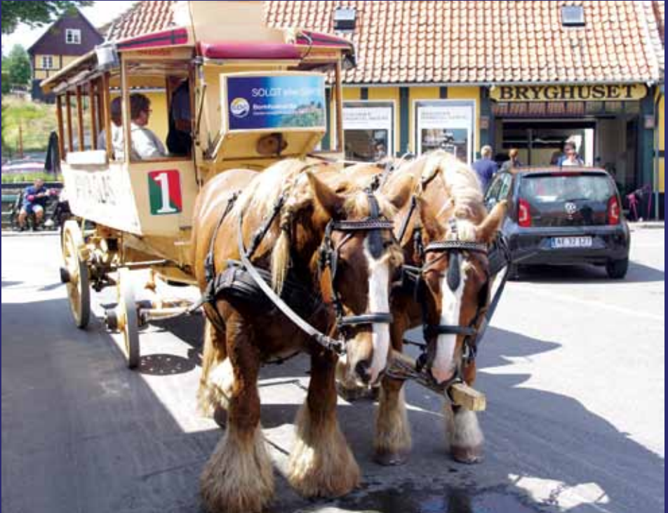
Alla på Bornholm ställde upp för SXXs rikseskader