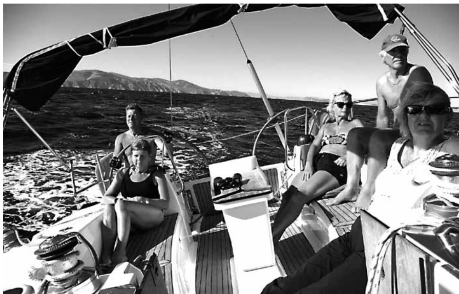
På kryss mot Perdika

Se fler sköna Greklandsbilder på nästa sidor!