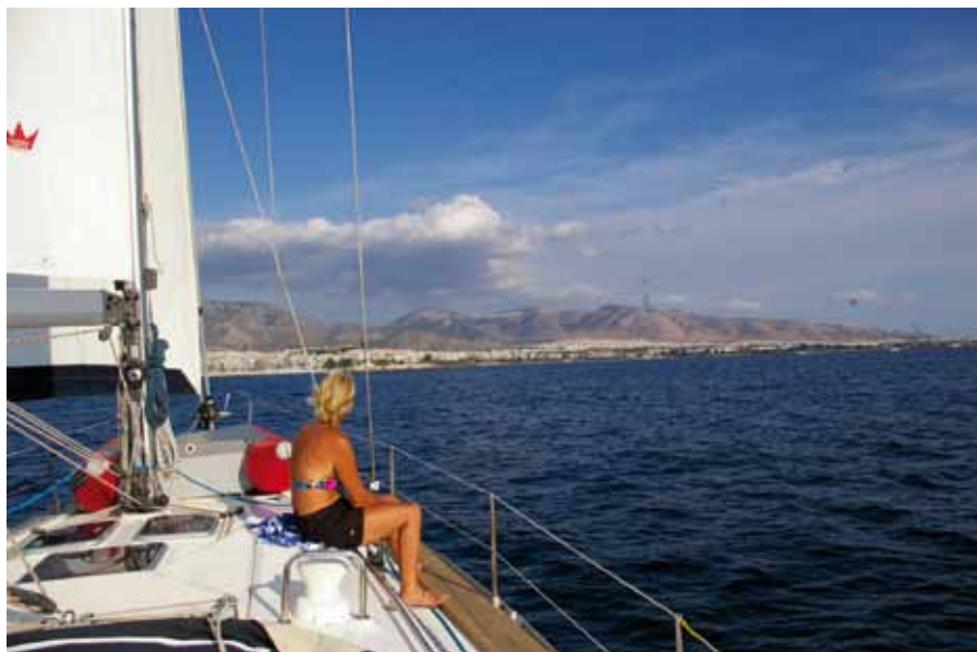
Snart åter i Kalamaki