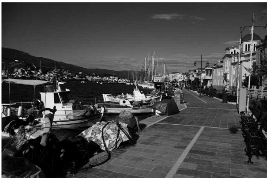
Strandpromenaden i Poros