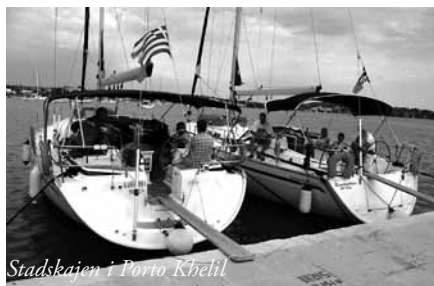
Stadskajen i Porto Khefil

Ännu en varm och solig dag! Tog en snabb promenad på morgonen och var till saluhallen och handlade middagsmat till kvällen, som vi tillbringade i naturhamn vid Dhokos. Hoppade genast i sjön när vi kom fram, uppmätte temperaturen till +26°, men det svalkade ändå, då det var +32 ° i skuggan i sittbrunnen. Vinden växlade rätt mycket i styrka och riktning under dagen, från medvind till kryss. Mycket vackert i viken med höga berg runt omkring, där det gick getter och några åsnor. Nere vid stranden låg ett litet kapell. När solen gick ner blev det verkligen mörkt. Åt en god middag bestående av färsbiffar och sallad med ett glas Retsina till i skenet från en pannlampa.