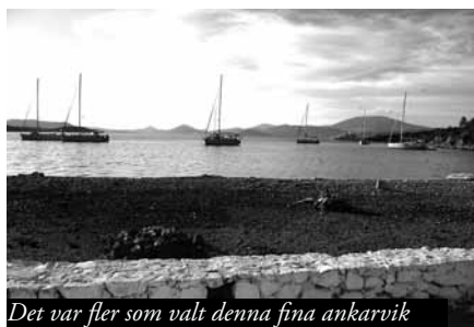
Det var fler som valt denna fina ankarvik