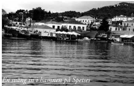
En sväng in i hamnen på Spetses

En härlig morgon med strålande sol och avtagande vindar. Seglade mot Poros. Lätta vindar som mest var emot. Valde att segla väster om Aegina, där vi fick medvind ner i sundet. Det blev en heldag denna första dag på havet, var inte framme förrän kl. 18.30 och la oss utanpå Kassandra nedanför restaurang Oasis, där Sunwaves Travel bjöd oss på en välsmakande middag bestående av många grekiska specialiteter. Poros ligger vackert vid sundet mot Peloponnesos och har en lång strandpromenad och ovanför breder byn ut sig. Kvällen avslutades på en uteservering på strandpromenaden med glass smaksatt med pistagenötter från Aegina. Betalade enda hamnavgiften under veckan på 3.50 Euro.