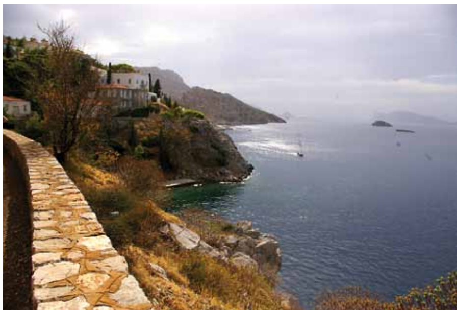
Storslagen utsikt från Hydra