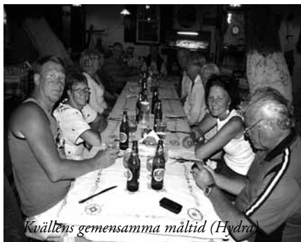
Kvällens gemensamma måltid (Hydra)

var kö till duschen. Var ute och åt på en trevlig trädgårdservering lite längre upp i gränderna. När vi sen kom ner till hamnen för att dricka kaffe började det att blåsa ordentligt. Vinden vände på några minuter och kom rakt utifrån och det blev ordentlig sjöhävning i hamnen. Båtar slog ihop och några fick i all hast lämna hamnen. Våra ankare höll som tur var, men vi var uppe och vaktade några timmar innan vinden avtog något och vi kunde få några timmars sömn.