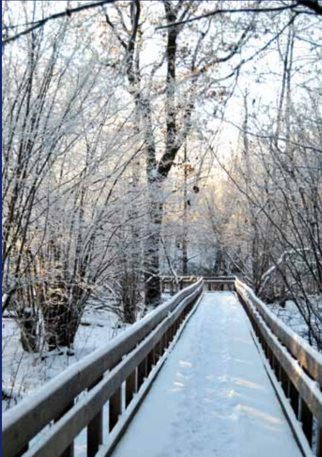
Bro mot sommaren ?