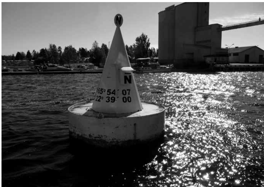
Målet nått, Bojen i Töre...