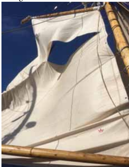
Storseglet skörde i hårt väder

Nästa förmiddag blåste det upp. Britiska Metoffice rapporterade sydostlig vind med risk för "severe gale", styv kuling. Hela besättningen förberedde sig med att sjöstuva noga under däck, stänga ventiler och luckor och koppla säkerhetslinor. Ett rev sattes i storen, focken skotades hårt, klyvare och jagare låg undanstuvade. De som inte hade en uppgift att sköta satt fastkopplade till mantåget på babordsidan. I en stormby skörde plötsligt storseglet.