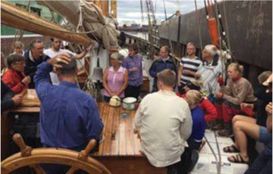
Hela besättningen på akterdäck

ju Gratitudes storlek den som gällde för den seglande fiskeflottan kring sekelskiftet 1900, för att kunna framföra fartyget med minimal besättning. Atlantica är i detta sammanhang för stor.