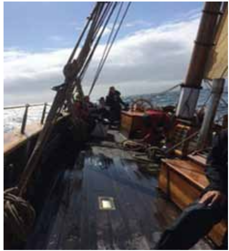
Atlantica gick tungt och säkert i den tidvis hårda vinden och grova sjön.