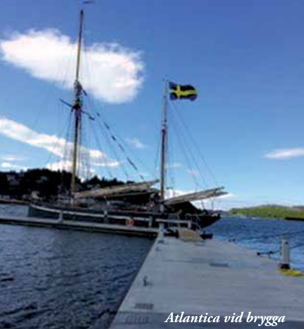
Atlantica vid brygga