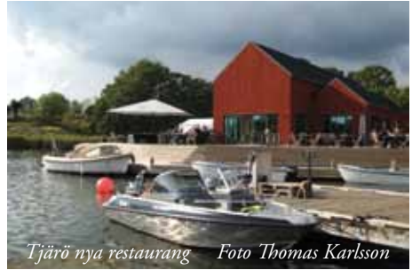
Tjärö nya restaurang