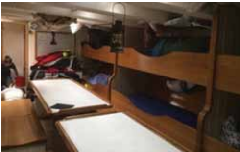
12 kojor i mässen - trångt om saligheten